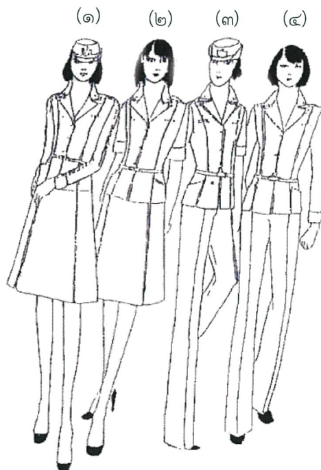
(๑) เครื่องแบบสีกากีคอแบะแขนยาวปล่อยเอวสวมกับกระโปรง (๒) เครื่องแบบสีกากีคอแบะแขนสั้นปล่อยเอวสวมกับกระโปรง (๓) เครื่องแบบสีกากีคอแบะแขนสั้นปล่อยเอวสวมกับกางเกง (๔) เครื่องแบบสีกากีคอแบะแขนยาวปล่อยเอวสวมกับกางเกง