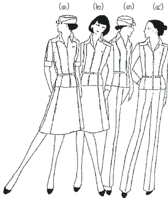
(๑) เครื่องแบบสีกากีคอพับแขนสั้นปล่อยเอวสวมกับกระโปรง (๒) เครื่องแบบสีกากีคอพับแขนยาวปล่อยเอวสวมกับกระโปรง (๓) เครื่องแบบสีกากีคอพับแขนสั้นปล่อยเอวสวมกับกางเกง (๔) เครื่องแบบสีกากีคอพับแขนยาวปล่อยเอวสวมกับกางเกง